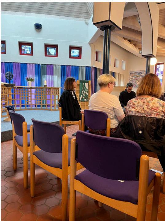
Meditativer Gottesdienst in der Jakobuskirche