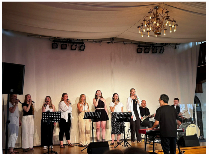
Sommerkonzert des TIC-Vokalensembles